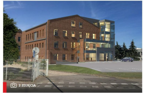
• AMGS Group z Gdańska przebuduje budynek przy Dębowej 4 i stworzy tam zakład produkcyjny. Wizualizacja inwestycji wykonana przez biuro projektowe Rodak Architekci (Rodak Architekci - Biuro Projektowe Radom)

O becną rdzawą elewację zastąpi efektowna cegła, a cały obiekt zostanie przebudowany w nowoczesnym stylu.