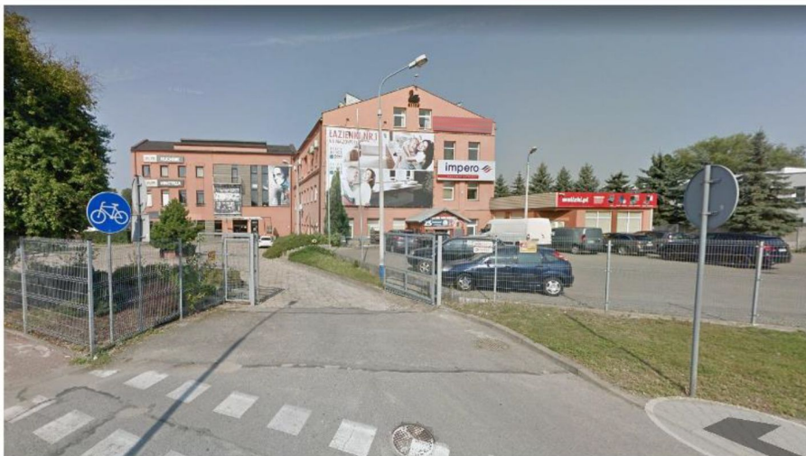
• Radom, ul. Dębowa 4